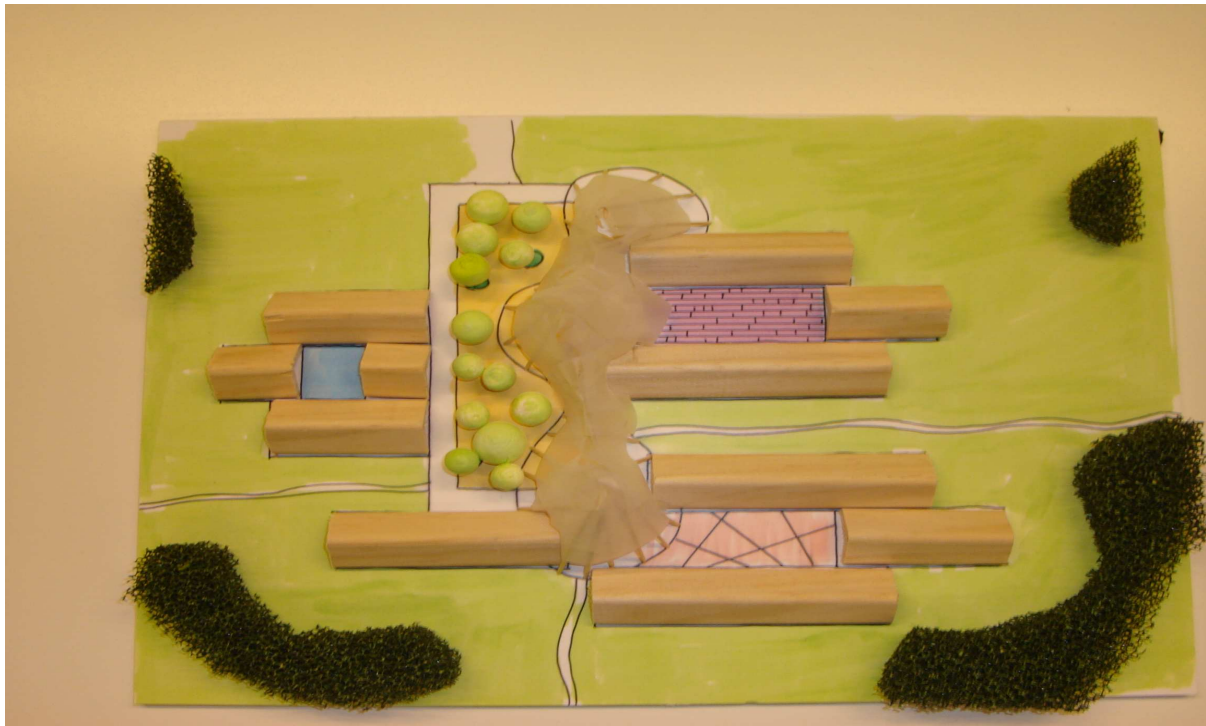
De maquette van de basisschool en voor- en naschoolse opvang inclusief sportfaciliteit, zwembad, bibliotheek

De gebouwen worden neergezet vlakbij de lokale gemeenschappen. De nadruk ligt op duurzaamheid, klimaatbestendig en milieubesparend bouwen, autarkische voorzieningencentrum. Realiseren van gebouwen en hun inrichting. Het betreft gebouwen voor kinderopvang, scholen, ziekenhuizen, zwembad, sportaccommodatie, bibliotheek, shelters, huurwoningen en buurtcentra. Naast stenen wordt ook inrichting van gebouw en landschap onder de fysieke pijler verstaan. In 2009 willen we bovenstaande gerealiseerd hebben. Daarna willen we de middelbare school gaan toevoegen volgens hetzelfde concept.